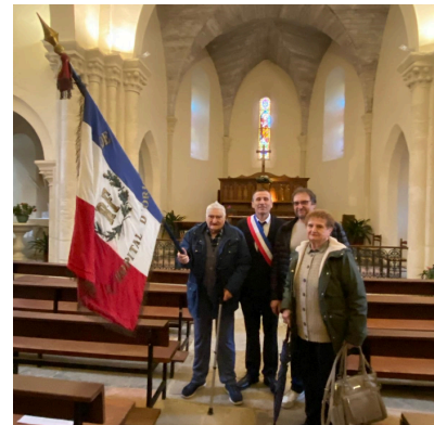
Festivités du 11 novembre 2024

Le Conseil Municipal de L'HÔPITAL-D'ORION vous présentera tous ses vœux de bonheur et de santé pour cette nouvelle année le Samedi 18 janvier à partir de 18h à la salle communale.