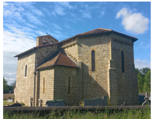
En haut : durant les travaux. En bas : travaux finalisés