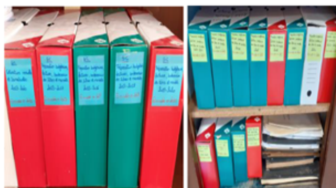
Archives en attente d'élimination