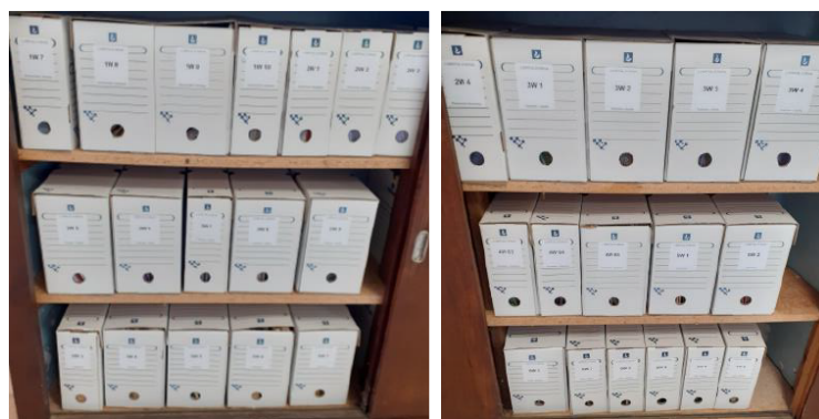
Archives définitives (classement, mise en boîtes, étiquetage)

Le coût de l'opération s'élève à 4 480 € TTC + 560€ TTC pour les archives du SIC rapatriées d'Orion à L'Hôpital-d'Orion.